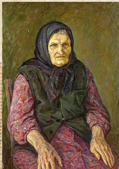
«Моя мама Маланья Семеновна», 1978 г.

Саврасовым, Венециановым, Репиным, Васнецовым и другими выдающимися русскими художниками — он вошел в книгу «Самые знаменитые живописцы России». Составители этой энциклопедии назвали Овчинникова большим талантом и настоящим народным художником.