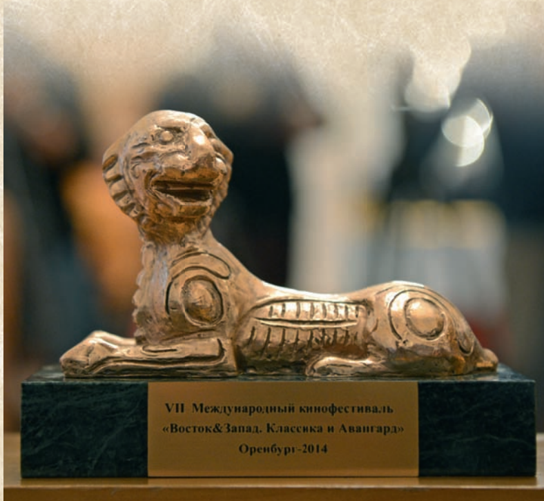
VII Международный кинофестиваль «Восток&Запад. Классика и Авангард» Оренбург-2014