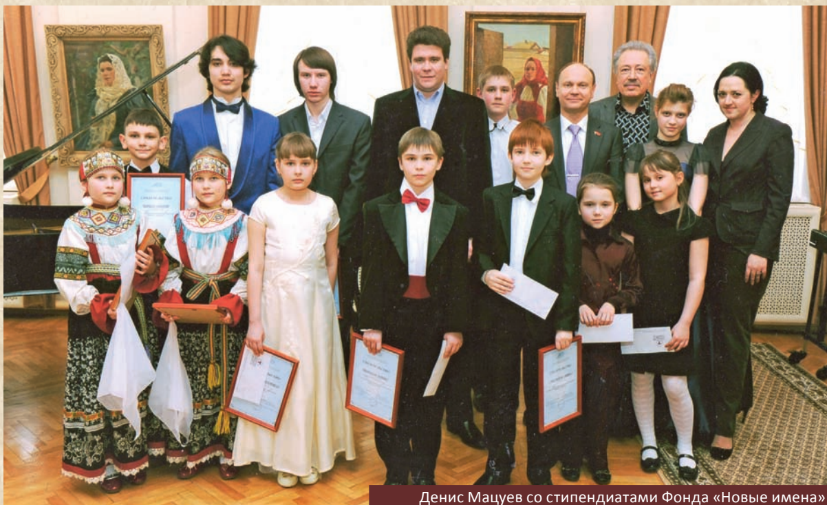
Денис Мацуев со стипендиатами Фонда «Новые имена»

— Фортепианное всегда было главенствующим среди наших отделений. Фортепиано как инструмент — основа любой специальности. Начинает возрождаться интерес к струнным инструментам — скрипке, виолончели, альту. Много желающих научиться играть на народных