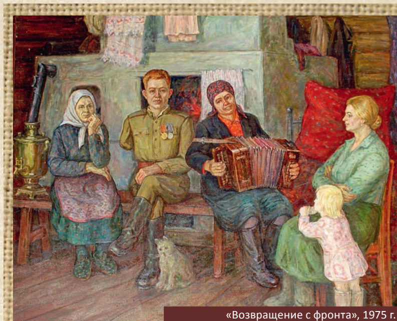
«Возвращение с фронта», 1975 г.

У Овчинникова до сей поры нет диплома о специальном образовании. Хотя в своей профессии он имеет самые полные, можно сказать академические, познания. Просто у него были свои университеты. В 17 лет приехал в город. Вошел в круг оренбургских художников, с жадностью впитывая новое. Бывал в