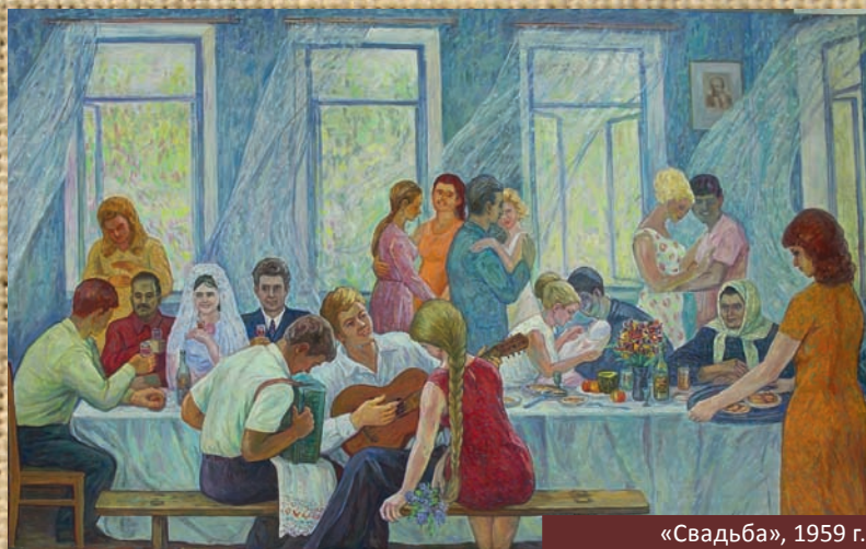
«Свадьба», 1959 г.

он работал. Писал побережье океана, индийские храмы, монахов. Привез, помимо сотни рисунков, десятки четыре эскизов. Принял участие в двух отчетных выставках: одна прошла в Оренбурге в Центральном выставочном зале, другая — в Третьяковской галерее. До сих пор не может забыть Индию. В 84 года побывал в Китае, приняв участие в выставке российских художников, среди которых сплошь академики и народные художники, такие, как Зураб Церетели или Михаил Ромadin. Повез более 20 работ, полтора десятка приобрел владелец китайско-российской картинной галереи в Харбине. Обещал сделать отдельный зал для его работ, такой чести здесь удостоиваются лишь академики живописи.