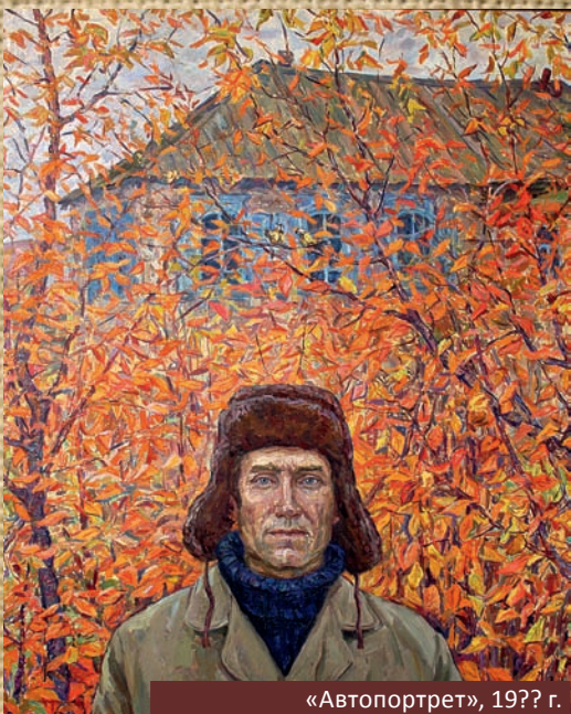
«Автопортрет», 19?? г.