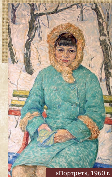
«Портрет», 1960 г.